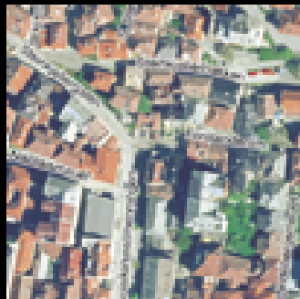
8 flyfoto av sentrum i målestokk 1:2.600