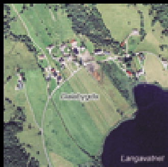
18 flyfoto av fjell og land i måle- stokk 1:13.000