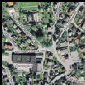
90 flyfoto av tettbebygde områder i målestokk 1:6.500